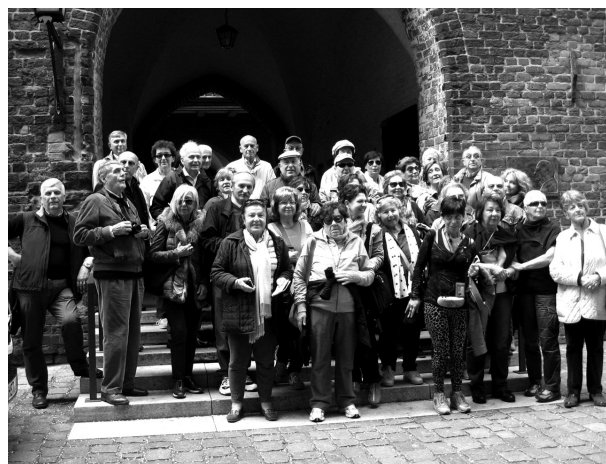
maggio 2014 - Foto di gruppo a Stralsund - Gita nelle Città Anseatiche - Germania nord