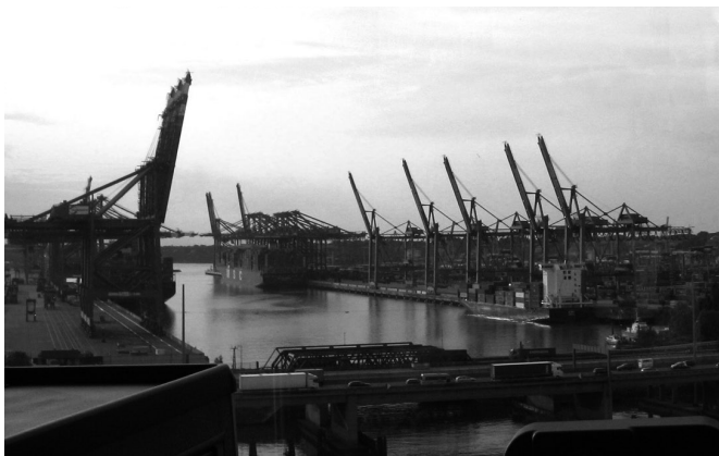
maggio 2014 - Porto di Amburgo Gita nelle Città Anseatiche - Germania nord