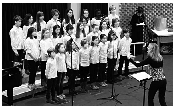
Il Coro Libere note della scuola F. Mordani

dalla fondazione della Coop culturale e ricreativa "Pensiero e Azione"